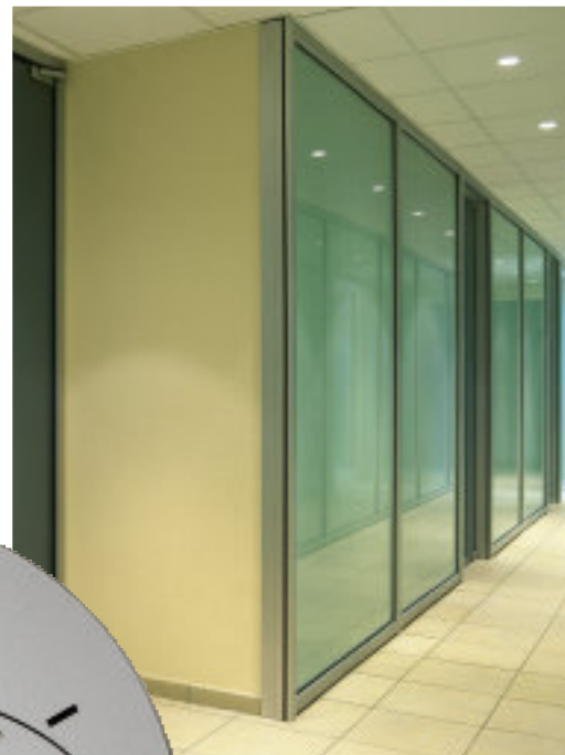
▲ Bureau scheidingswanden Orchard Ref 1604 - SAFE versie