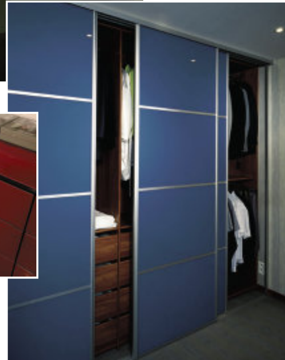
▲ Schuifdeuren voor dressing Ocean Ref 1227 - SAFE versie