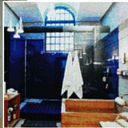
▲ Wandbekleding voor badkamer (binnen de douche) Marine RAL 5002 - SAFE versie