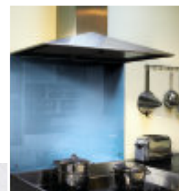
◀ Bekleding voor bescherming van keukenwanden Soft Blue ref 1435 - SAFE versie